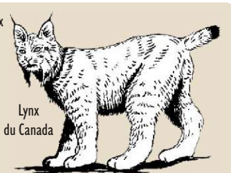
Lynx du Canada