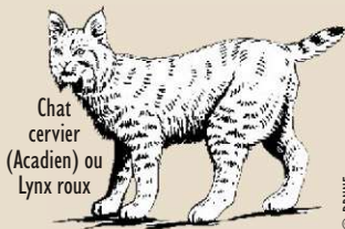
Chat cervier (Acadien) ou Lynx roux